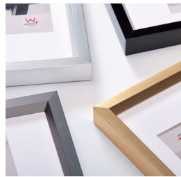
Neue quadratische Formate ergänzen den Kunststoffrahmen Steel Style, ebenfalls aus der Wohnwelt Classic Chic.

Chair, ein klassischer Aluminiumrahmen aus der Wohnwelt Classic Chic, wird um die Formate DIN A1, A2 und A3 erweitert. Zudem nimmt walther design die Großformate 60 x 80 cm und 70 x 100 cm in die Formatauswahl auf. Chair ist in fünf metallischen Farben erhältlich. Auch der